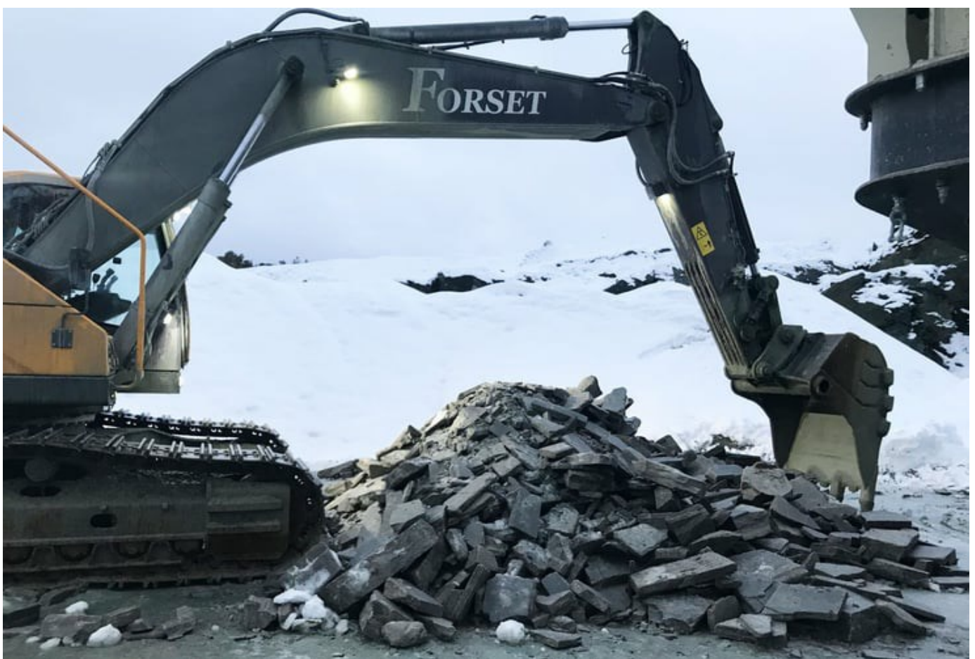
Overskuddsmasse fra skiferproduksjon, klar for prøvekning.

Resultatene fra prosjektet er at utnyttelsen av overskuddsmassene er et godt miljøvalg. Analyser viser at utnyttelse i form av knusing til nye produkter gir lavere CO 2 -avtrykk enn deponering, og knust skifer fra overskuddsmassene kan ha et lavere CO 2 -avtrykk enn knust tilslag fra fast fjell. Dette kan gi konkurransefortrinn i markedet.