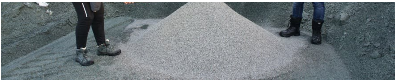
Skiferkvaliteten undersøkes grundig.

Hovedformålet med samarbeidsprosjektet har vært å avklare mulighetene for et samarbeid og en ny bedriftsvirksomhet basert på produksjon og salg av knust tilslag av kvartsskifer fra skiferbruddene på Oppdal. Overskuddsmassene har ikke tidligere vært anvendt i knust form, og i prosjektet er det gjort vurderinger av hva som samlet sett kan gi den beste ressursutnyttelsen, massehåndteringen, logistikken og produksjonen, både med tanke på økonomi, energiforbruk og miljøfotavtrykk.