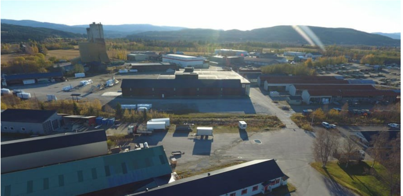
Skogmo Industripark i Namdalen.

AV IDA VALSØ | PUBLISERT 19. OKT. 2021 | OPPDATERT 2. MARS 2023